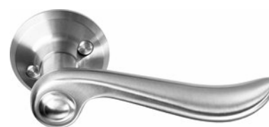
レバーハンドル/シリンダー錠/サムターン マットクロム仕上げ